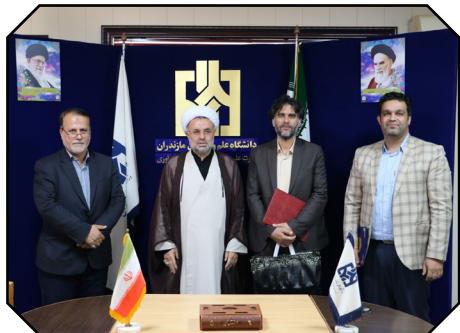
انتصاب سرپرستان معاونت اداری، مالی و مدیریت منابع و حوزه‌ی امور پژوهش و فناوری