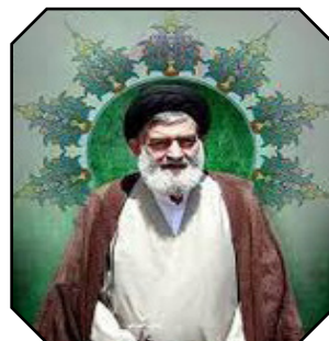
مفاخر علمی شهرستان بهشهر آیت الله سید صابر جباری

۹ نشست صمیمانه مدیریت و کارکنان دانشگاه علم و فناوری مازندران