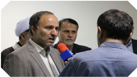
بازدید رئیس سازمان امور دانشجویان وزارت علوم، تحقیقات و فناوری از دانشگاه علم و فناوری مازندران