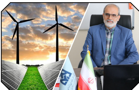
اخذ موافقت قطعی با ایجاد رشته «مهندسی انرژی» در مقطع کارشناسی

۳ سلسله نشست‌های کارگروه محیط‌زیست و انرژی قرارگاه تولید، دانش‌بنیان و اشتغال آفرین استان مازندران