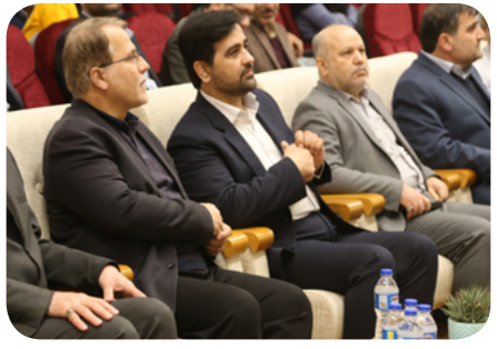
برگزاری رویداد ملی استارت آپی خلاق شو با معرفی نفرت و شرکت های برتر