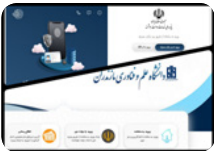
اتصال سامانه‌های آموزشی و پژوهشی دانشگاه علم و فناوری مازندران به پنجره ملی خدمات دولت هوشمند