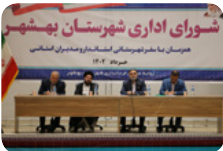
میزبانی دانشگاه علم و فناوری مازندران از جلسات شورای اداری، ستاد تسهیل و دیدار اقشاری شهرستان بهشهر