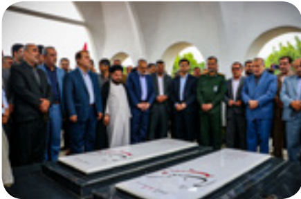
برگزاری اولین یادواره شهدای گمنام شرق استان مازندران به میزبانی دانشگاه علم و فناوری مازندران